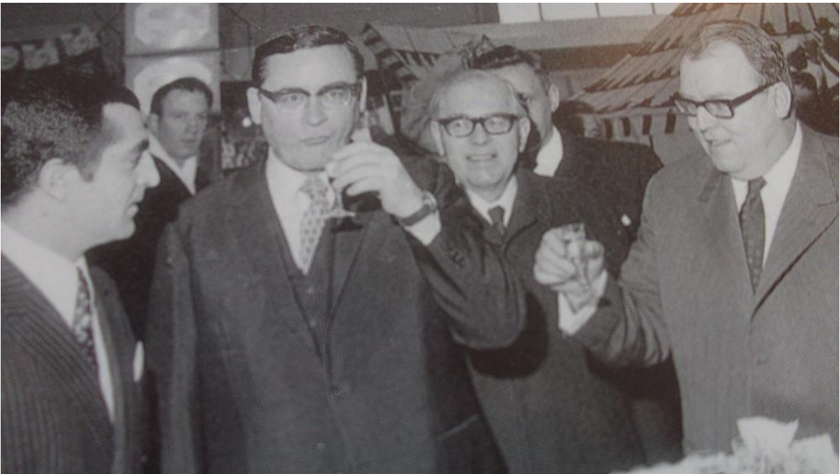
کاک عهلی له گه‌ل به‌پرسیانی ئالمان