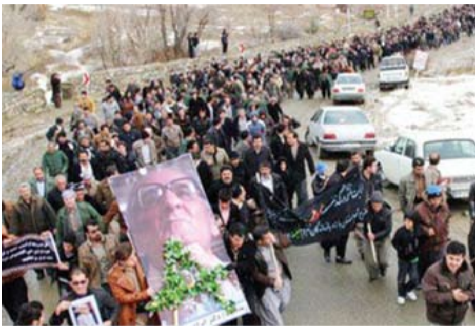
بانه. ۲۱ رێبه‌ندانێ ۱۳۹۰. رۆبه‌سه‌ی به‌خاکسپاردنی ته‌رمی مامۆستا ئیبراهیم یونس، گه‌وره‌هه‌رگه‌ز و نووسه‌ری کورد

ئه‌وه‌ی له‌و «جنوون»ه خه‌سار ده‌بین، خه‌لکی جیهان به‌گه‌شتی و خه‌لکی ئێران به‌تایه‌یه‌تین و به‌م پێشه‌یه‌که‌گرتووبی و هه‌وکه‌گی خه‌لکی جیهان و خه‌لکی ئێران، پێوستیه‌کی بیه‌ملا‌وه‌ولایه بۆ ده‌ربازبوون له‌و قه‌یرانه‌ی که ئه‌و رێژیمه پێکی هه‌یتان.