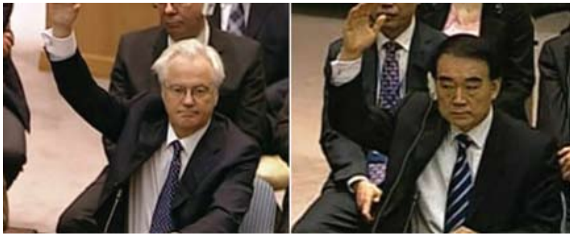
بؤ هاوکاری زیاتری هيزه ديئوکرات و پيشکه‌وتوه‌کاتي نيزان تيبکؤشين

هه‌لؤستيتک که نه‌ته‌تيا هيچ کاریگه‌ريه‌ی که له سهر دامرکندنی هه‌ستی نازاديوخازانه‌ی خه‌لکی راپه‌ريوی نهو ولاته دانه‌نا، به‌لکوه تم گه‌له، وئرای مه‌حکومکردنی هه‌لؤستی نابهرپرسيارانه‌ی چین و روسیه، به‌گؤرت له راپرده‌وو هاواری مافخوازانه‌ی خؤيان به‌رز کردؤته‌وه و هه‌نووکه به پشتبه‌ستن به هيز و نياده‌ی نازاديوخازانه‌ی خؤيان و سهره‌پای کوشتار و توندوتیزيه‌کاتي هيزه مرؤفکؤزه‌کاتي رېژیمی نه‌سه‌د، خه‌بات و تیکوشانی هه‌قخازانه‌ی خؤيان له پیناو نه‌هيشته‌وه‌ی ديکتاتوری و جیگيرکردنی ناشتی و نازادی داپه‌روه‌ی کؤمه‌لايه‌تی و گه‌يشتن به نامانجه به‌رز مرؤيه‌کانيان دريژه پي دده‌ن. هه‌روه‌ها به دريژه‌ده‌ن به فيداکاری و گيانبازی خؤيان له پیناو نه‌هيشته‌وه‌ی ديکتاتوری، نيشانان دا که نه‌وانه‌ی له پیناو پاوانخواری و به‌رؤه‌نديه‌کانياندا، ساتوسه‌ودا له‌سهر مافی مرؤف و به‌ها و که‌رامه‌تی ئينسانه‌کان ده‌کن، ريسوا و شه‌رمه‌زاری ميژوون.