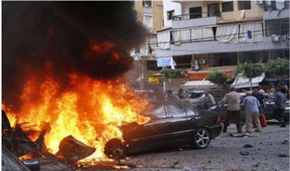
تەقینه وەهكانى لوبنان و قەیرانى سووربه

رۆژى هەینى رێكەوتى 1ى خەرمانان بەرانبەر لەگەل 23ى ئووت، چەند تەقینهوى بەهێز لە ترابولوسى لوبنان روویان دا كه بە پێى ئامارەكان 45 كوژراو و زیاتر لە 500 كەس كوژراوى لێكەوتەوه. ئەمە بە خوێناویترین رووداوى تیزۆرستى لە پاش كۆتایى شەرى ئێوخۆی لوبنان لە سالى 1990ى زایینی دیتە ئەژمار. لقی باكوری نافرینقای ئەلقاعیدە، حیزبۆللاى لوبنانى بە بەرپرسی ئەم رووداوانە تۆمەتبار كردووه و هەر دەشەى لێكردوون كه حیزبۆللا لە بەرانبەر ئەم كۆمەڵە سزا دەدرێت. ئەم تەقینهوى ترابولوس (سونى نشین) پاش تەقینهوهكەى شارى بېرووت (شیعەنشین) هاتە ئاواوه. واتە یەكەم گریمانە كه سەبارەت بەم پرسە دەكرێت ئەوهیه كه زنجیره تەقینهوهكانى لوبنان چەشتىك لە شەرى مەزەهەبى ئەم وڵاتیه كه تیدیدا پێرەوى لە میتۆدى "كوشتنى