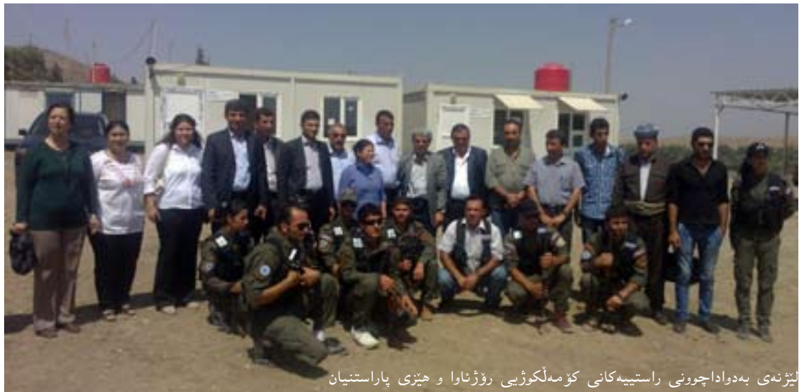
لێژنى بەواداچوونی راستییهكانى كۆمەلگۆزى رۆژناوا و هېرشى پاراستیان

تیدایه، بەلام ناى ئەو هەشمان لەبیر بچێ كه چۆلكردنى كوردستان دەبێتە هۆى گۆرپى دیموگرافى كوردستان و نیشتهجى بوونی عەرەبەكان لە شوێنى كوردەكاندا، بەپێى قەسەى بەرپرسان لە شارى قامیشلوودا رێژەى كورد و عەرەب وەك یەكن. بۆخۆیان كەمپ لەو بەشەدا دروست بكەن و تیدان نیشتهجى بن، بەلام شونى خۆیان نەفرۆشن. لەو شوپنانهى كه كورد دەژین، هەمیشە سیاسەتى رێژیم تەعریب كردن بووه بۆ ئەوهى سووربه و لايتىكى عەرەبى بى، نەك عەرەبى و كوردى.