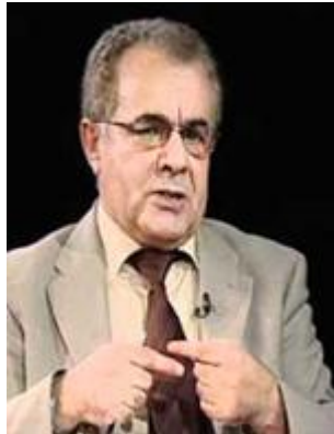
1- شاھۆ حوسىنى خەلكى پاوہ نوینەرى حىزب لە دەرەوہى ولات

ئەو كەسانەى كە وەك ئەندامى كۆمىتەى ناوەندى بۆ بەرپۆەبردنى كاروبارى دەرەوہى ولات ھەلبژێردراون برىتىن لە بەرپۆان: