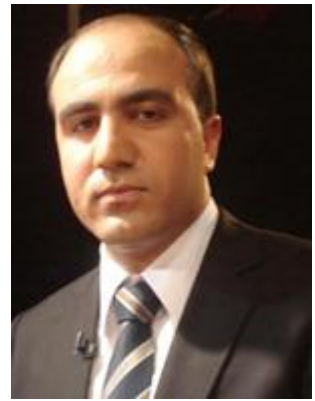
21- دارا نانتق خه لکي ورمي