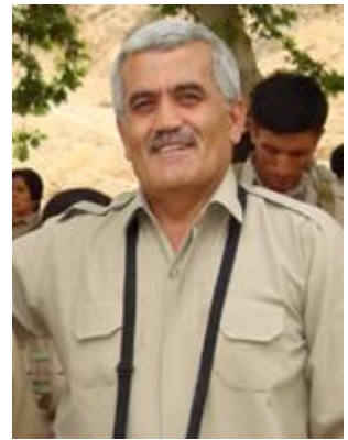
9. چہکوۆ رھیمی خہلکی مہاباد