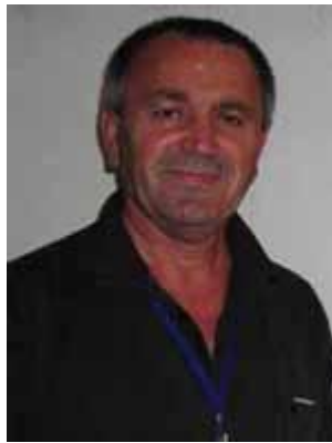
8. میرۆ عہلیار خہلکی بۆکان