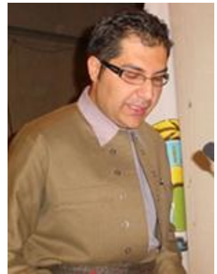
12. شاھۆ فہرازمہند خہلکی مہاباد