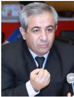
18- تاهير مهحموودي خه لکي پيرانشار