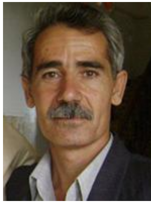
20- لوقمان ميپفه خه لکي شنو