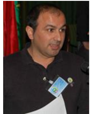
4- نازاد عەزىزى خەلكى بۆكان

لە داھاتوودا لەسەر برپارى كۆنگرە، كۆمىتەى ناۋەندى لە پلىنۆمەكانى خۆيدا دەتوانى بە پپى پپويستو لانى زۆر ھەتا نيۋەى ژمارەى ئەندامانى ئەسلى، كەسانىك ۋەكۆۋ موشاۋىرى كۆمىتەى ناۋەندى ھەلبىزىرئ. پپويستە بگوترى ئەندامانى كۆمىتەى ناۋەندى لە دەرەۋەى ۆلات بۇ يەكەم جار راستەوخۇۋ لە كۆنگرەدا دەنگيان پپى دراۋو پپىشتر لەسەر برپارى كۆنگرە لە پلىنۆمەكانى كۆمىتەى ناۋەندىدا كەسانىك ۋەكۆۋ كۆمىتەى ناۋەندى لە دەرەۋەى ۆلات ھەلبىزىردران.