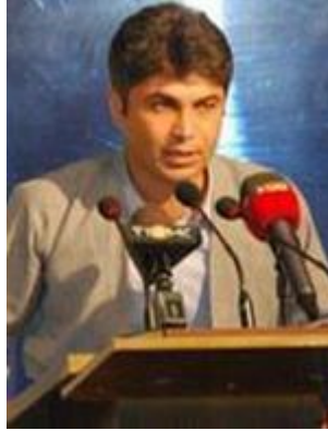
2- فواد خاکی بهیگی خهلكى دیواندهره سكرتيرى بهكیهتیبى لاوانى دیموکراتى كوردستانى ئیران