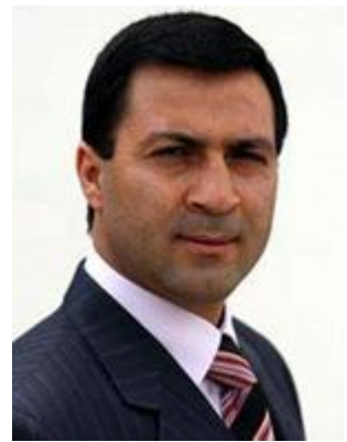
17- محهمه د سالح قادری خه لکي سه لماس