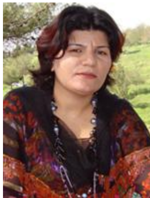
رووناك فهتحي خهلكى سهقز

ئەندامانی جیگری كۆمیتەى ناوەندی له كوردستان كه له هەلبژاردندا دەنگیان هیناوهتهوه بریتین له: