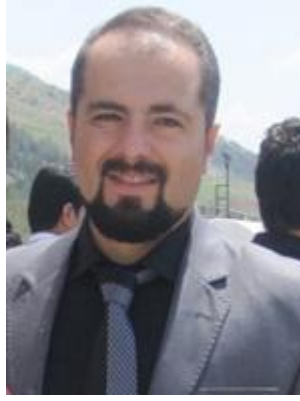
14- رامبوډ لوتفپووري خه لکي سنه