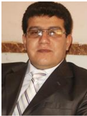
19- محهمه د ساحيبي خه لکي سه قز